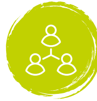
Restaurant als ontmoetingsruimte